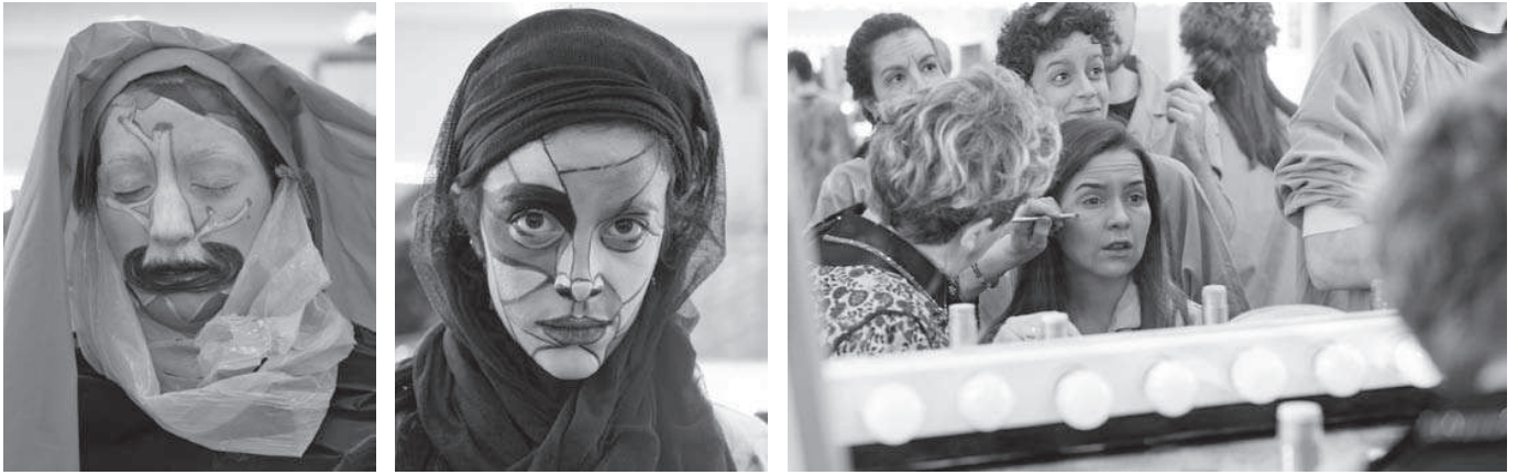
Clase de caracterización. RESAD.

representados es el Consejo Escolar; el resto de órganos son fundamentalmente del profesorado. Pero a través de las últimas instrucciones ya hemos incorporado a los alumnos otra vez en los órganos en que están los profesores, menos en el Claustro. En la COA (Comisión de Ordenación Académica), donde están representados todos los jefes de departamento, ya hay representante de los alumnos, y también lo hay en los departamentos didácticos.