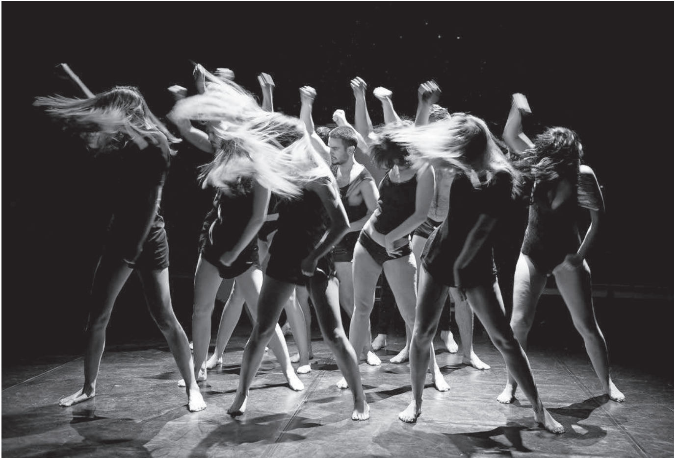
Dos escenas del taller de 4º curso de interpretación textual. "Snake in Fridge", de Brad Fraser. RESAD (2016).