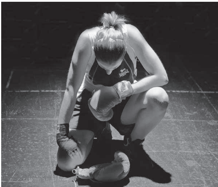
“Unos cuantos piquetitos”, texto de Laila Ripoll con dirección de Helena Soriano. A la izq., TFE dirigido por Helena Mocejón “Bix Boxer”, de Charlotte Josephine. RESAD (2016).

con aquellos que no los tengamos. Por ejemplo, ya tenemos un convenio que funciona muy bien con el INAEM, y gracias a él hay alumnos en prácticas en el Centro Dramático Nacional, en la Compañía Nacional de Teatro Clásico, en la Zarzuela, en el Teatro