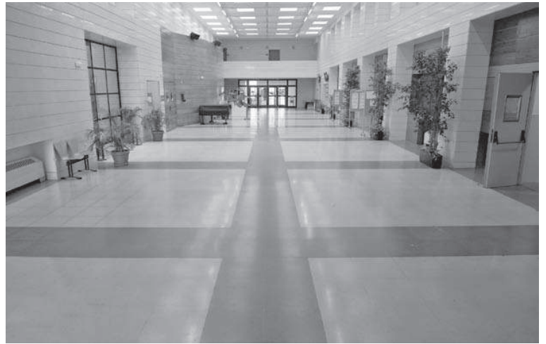
Teatros y vestíbulo de la RESAD de Madrid.